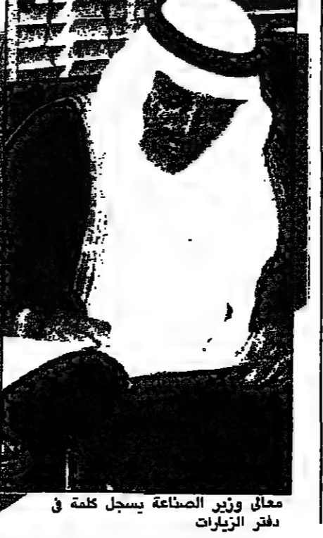
معالي وزير الصناعة يسجل كلمة في دفتر الزيارات